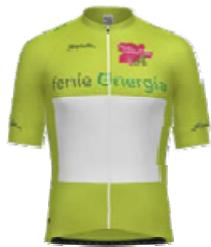
Maillot verde / Clasificación por Puntos / FENIE ENERGIA 2. BENNASSAR ROSSELLO Francesc EQUIPO CORTIZO