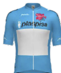
Maillot azul / Clasificación de Jóvenes / PLASPISA 176. FAJARDO PEREZ Samuel TENERIFE -BIKE POINT-LA SEDE