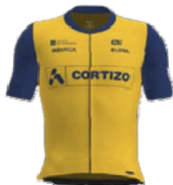
Mejor equipo EQUIPO CORTIZO